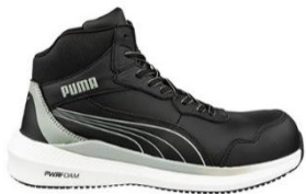
ZOOM BLACK MID 635030