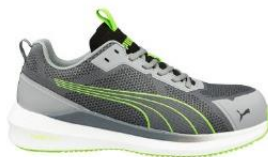
SLIDE GREY/GREEN LOW 654010